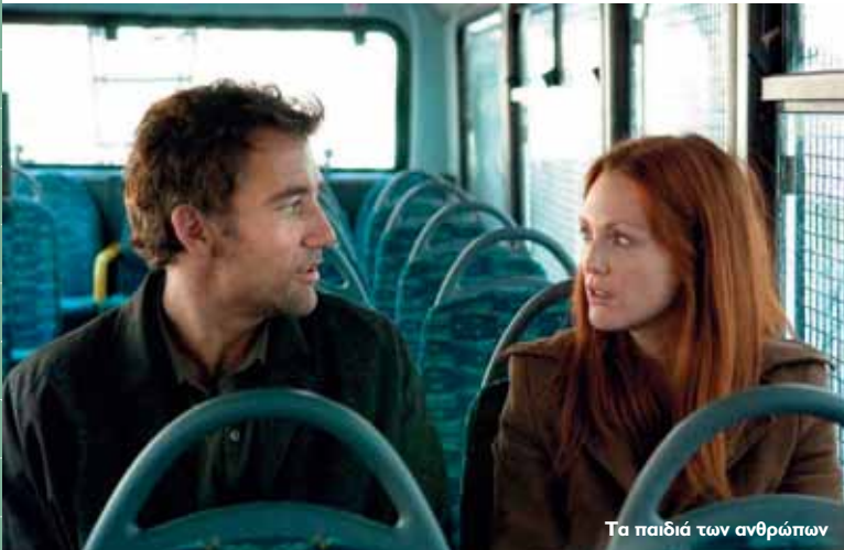
Τα παιδιά των ανθρώπων

Όσο για τον Δρόμο για το Γκουαντανάμο ο Μάικλ Γουιντερμπτόμ συνέχισε την εξερεύνηση του πραγματικού μέσα από μια ντοκιμαντερίστικη διάσταση. Από εκεί και μετά, από άποψη ποιότητας, ο γιος του Ιβάν Ράιτμαν (που παρεμπιπτόντως μας πρόσφερε το συμπαθές My super ex girlfriend ) στα 29 του και με τον Άαρντ Έκχαρτ, μου άρεσε με το Ευχαριστώ που καπνίζετε . Σε πρώ-