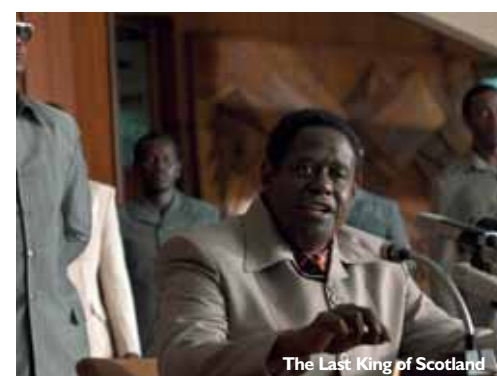
The Last King of Scotland