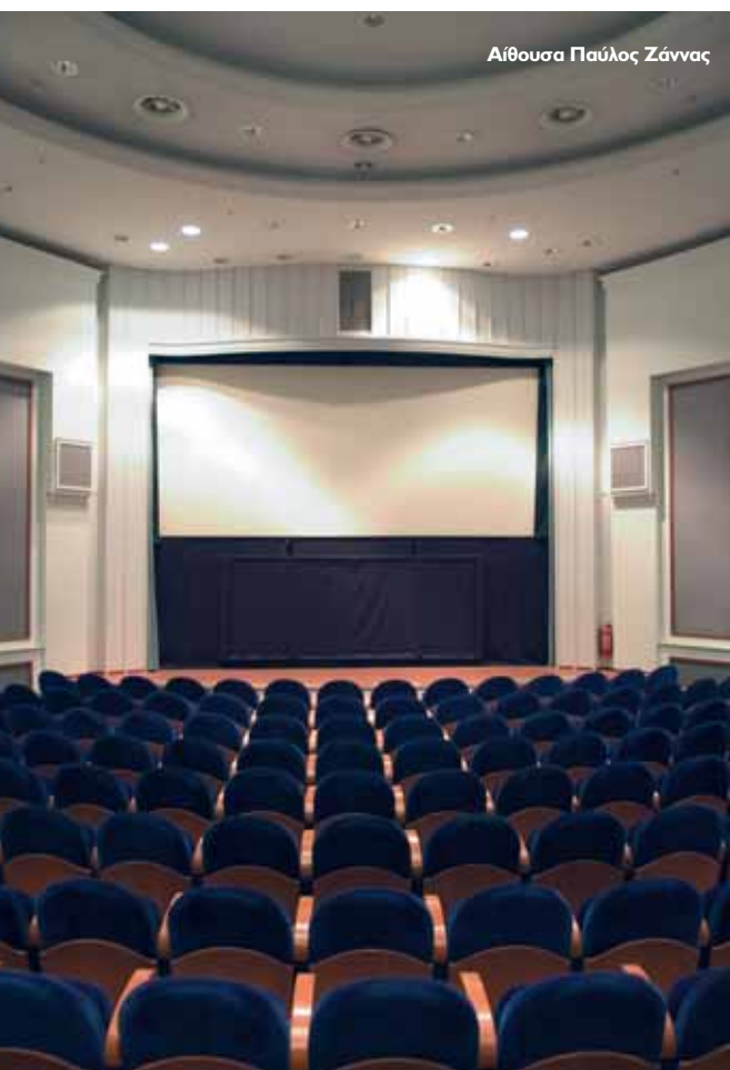
Αίθουσα Παύλος Ζάννας