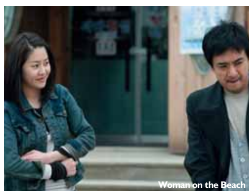
Woman on the Beach