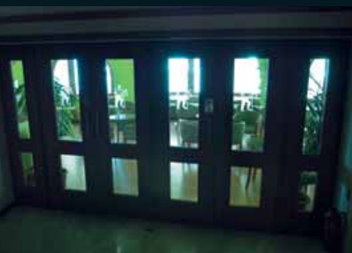
Δωμάτιο με Θέα