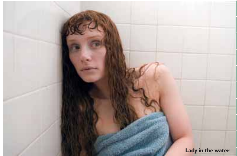
Lady in the water

τη φάση δείχνει ένα απλοϊκό φιλμ, αλλά στη συνέχεια μέσα από την ηρεμία του ξεδιπλώνει κάποιες ανησυχητικές προτάσεις μ' ένα αμφίσημο, ειρωνικό, διακριτικό στίλ.