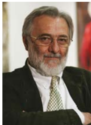
Γιάννης Σμαραγδής ΑΝΑΖΗΤΩΝΤΑΣ ΤΟΝ ΙΩΑΝΝΗ ΒΑΡΒΑΚΗ

Δεν επιχειρώ να διαμορφώσω μια άποψη για τον θεατή. Κατά την γνώμη μου, η ταινία αφήνει την ελευθερία στον θεατή να προσλάβει ότι επιλέξει από τα πολλαπλά μηνύματά της.